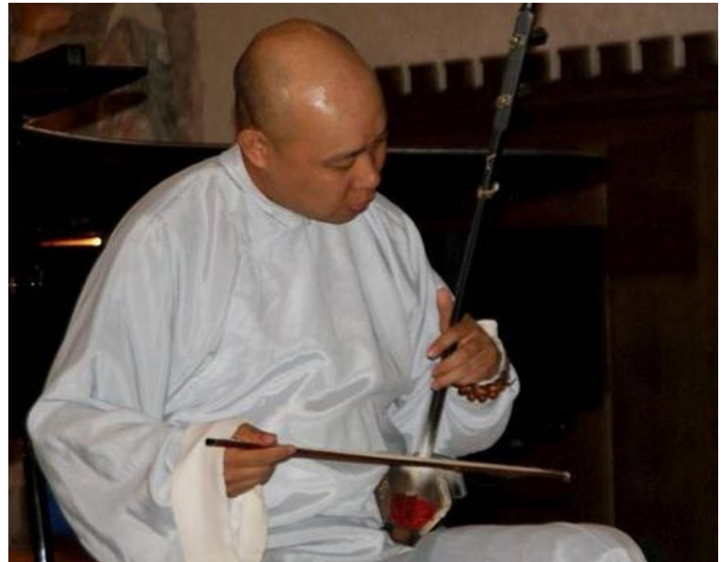
Guo Gan et son surprenant erhu.

Durant trois jours, concerts et improvisations se sont succédé à la Maison du braconnage, dans la rue, mais c'est surtout dans l'église du XI e siècle à l'acoustique exceptionnelle que l'émotion a été la plus forte, notamment lors du concert de clôture ce dimanche qui a rassemblé de nombreux spectateurs pour les prestations d'Alberto Casadei, violoniste italien aux nombreux prix internationaux, dont son premier à l'âge de 5 ans ; Guo Gan, musicien chinois et son erhu, instrument à cordes frottées, qui a joué avec les plus grands et notamment Chick Corrêa, Jean-Baptiste Aguessy, altiste sélectionné pour jouer avec l'international orchestra Attergau encadré par des musiciens de l'orchestre philharmonique de Vienne, et Jean-Baptiste Doucet, pianiste du conservatoire de Paris aux nombreux concerts comme pianiste improvisateur. Schubert, Bach, Tchaikovsky, Fauré et musique traditionnelle chinoise ont charmé l'assemblée qui ne tarissait pas d'éloges pour les musiciens à qui elle a fait une véritable ovation. Si ce concert fait partie des moments intenses de ce week-end, les prouesses de la pianiste Laurence Feltz, également à l'église samedi soir, ou encore celles de Jean-Marie Barbu sont à saluer également.